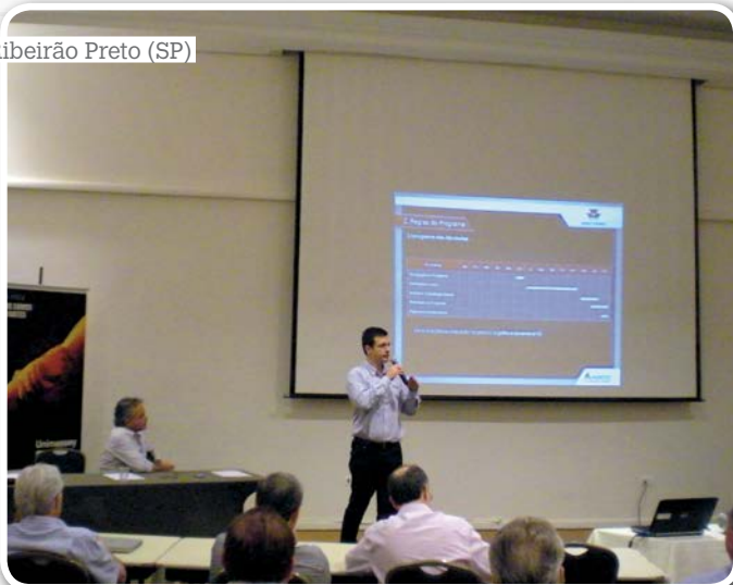
Ribeirão Preto (SP)