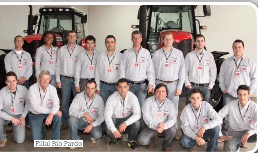
Filial Rio Pardo