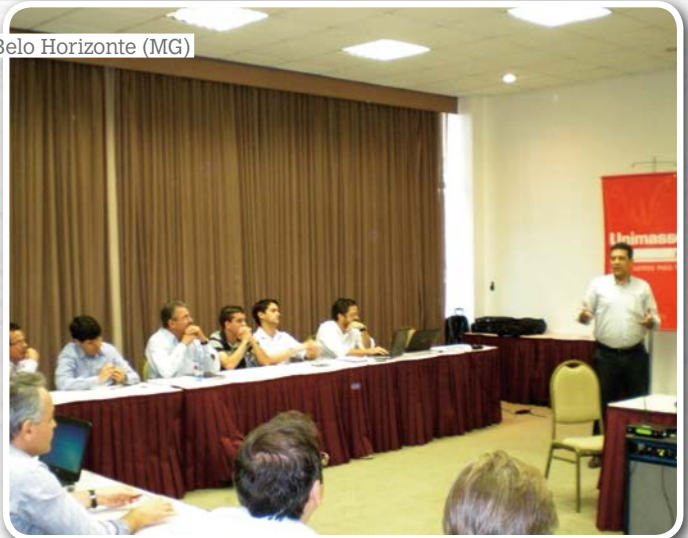
Belo Horizonte (MG)