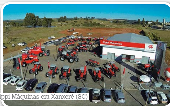
Pippi Máquinas em Xanxerê (SC)