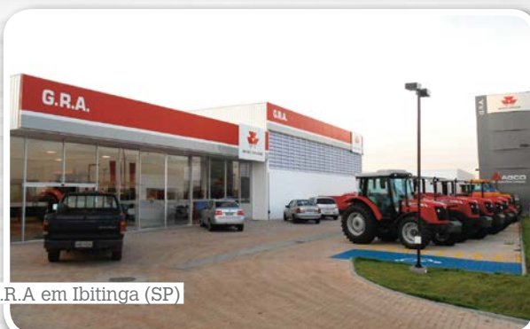
G.R.A. em Ibitinga (SP)