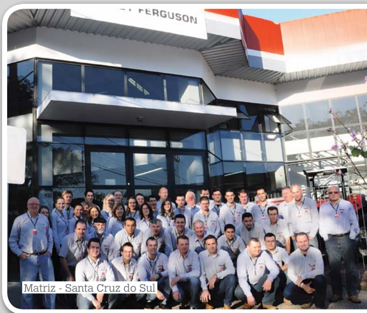
Matriz - Santa Cruz do Sul

Em março deste ano, aproveitando o clima festivo, a concessionária esteve presente na Expoagro Afubra, em Rio Pardo (RS). Na ocasião, foi sorteada entre os clientes uma viagem de sete dias com acompanhante para Porto Seguro (BA).