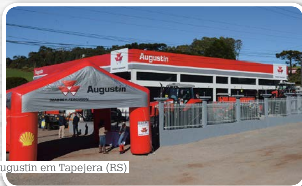
Augustin em Tapejara (RS)

A concessionária G.R.A., com atuação no interior de São Paulo, também inaugurou uma nova instalação. Com estruturas mais modernas e localização privilegiada, a loja vai ampliar as possibilidades de negócios da marca na região. A nova filial, em Ibitinga (SP), tem 3,7 mil metros quadrados e está localizado na principal via de acesso à cidade. Além disso, possui área externa para exposição de equipamentos e ampla oficina.