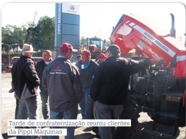
Tarde de confraternização reuniu clientes da Pippi Máquinas

A Pippi Máquinas, com atuação nos estados de Santa Catarina e Rio Grande do Sul, também prestou sua homenagem ao Dia do Agricultor. Em julho, a concessionária realizou uma tarde de confraternização especial na loja de Santo Augusto (RS). A reunião contou com show de música gaudéria, rodada de chimarrão e atividades lúdicas para filhos de clientes.