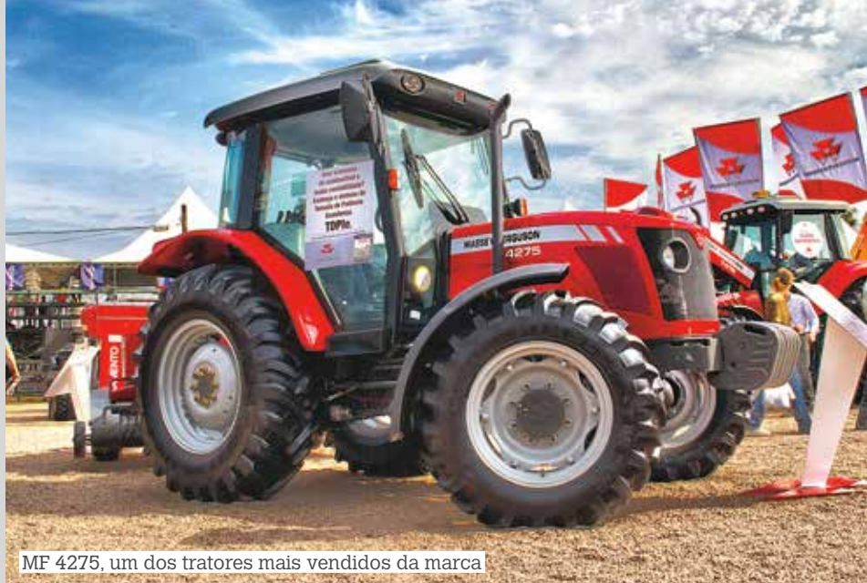
MF 4275, um dos tratores mais vendidos da marca