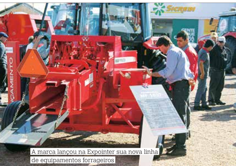
A marca lançou na Expointer sua nova linha de equipamentos forrageiros

A Massey Ferguson estreou, ainda na Expointer, sua linha completa de equipamentos forrageiros. Após anunciar em 2011 a entrada no segmento de enfardamento de biomassa, feno, forragens e palhas diversas por meio da MF 2170, a Massey Ferguson disponibiliza aos produtores e pecuaristas dois novos modelos de enfardadoras, a MF 1837 para fardos retangulares e MF 1745 para fardos cilíndricos. Dois modelos de segadoras para o início do processo, uma de sete discos de corte, a MF DM 1309, e uma de cinco discos, a MF DM 1358. Na continuidade, para o recolhimento da palha cortada e seca, a Massey Ferguson disponibiliza três opções de enleiradores, sendo dois modelos de rotor único, MF RK 3814 DN e MF RK 3802, e um com rotor duplo, o MF RK 3875.