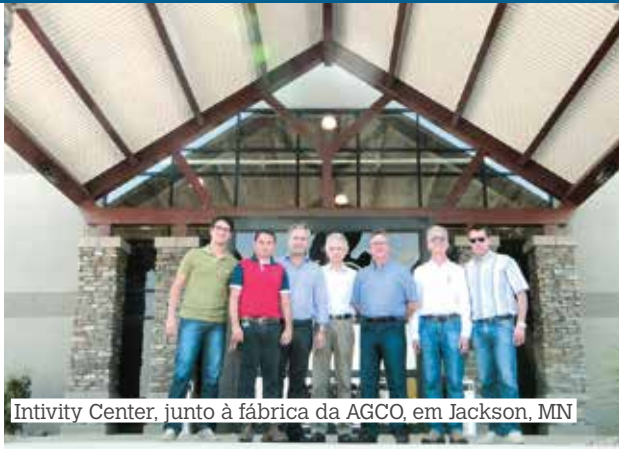
Intivity Center, junto à fábrica da AGCO, em Jackson, MN