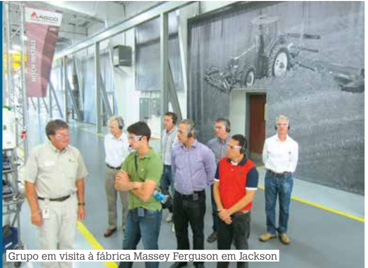
Grupo em visita à fábrica Massey Ferguson em Jackson

Em Jackson, onde esteve no dia 30, o grupo ficou impressionado com a excelência da linha de montagem dos tratores Massey Ferguson da Série 8600, recentemente inaugurada, e com a grandiosidade do Intivity Center, que se constitui em motivo de orgulho para as concessionárias das diversas marcas que compõem o universo AGCO. A produção local dessa série de tratores possibilitará à Massey Ferguson uma participação mais efetiva no mercado norte-americano de tratores de grande porte e suprir também mercados externos.