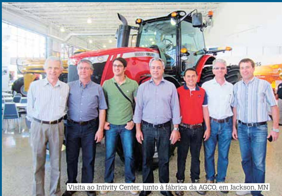
Visita ao Intivity Center, junto à fábrica da AGCO, em Jackson, MN

No primeiro dia da turnê os participantes estiveram na fábrica da AGCO em Hesston, no Kansas, onde são produzidas colheitadeiras, enfardadeiras e equipamentos de fenação. Em seguida, o grupo visitou a concessionária J&H Farm Equipment, em Newton, KS, que comercializa os tratores Massey Ferguson e as colheitadeiras Gleaner fabricadas em Hesston. Nos dias 28 e 29 foi a vez de conhecer a feira Farm Progress Show, em Boone (Iowa).