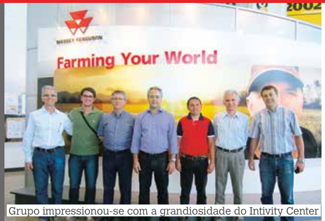
Grupo impressionou-se com a grandiosidade do Intivity Center

Os concessionários voltaram da viagem ainda mais motivados, confiantes na marca Massey Ferguson e cientes do enorme potencial de crescimento da mesma no mercado norte-americano, calcado principalmente na sua tradição, excelente imagem e suporte da AGCO com pesados investimentos em instalações e produtos que irão se refletir também no mercado brasileiro.