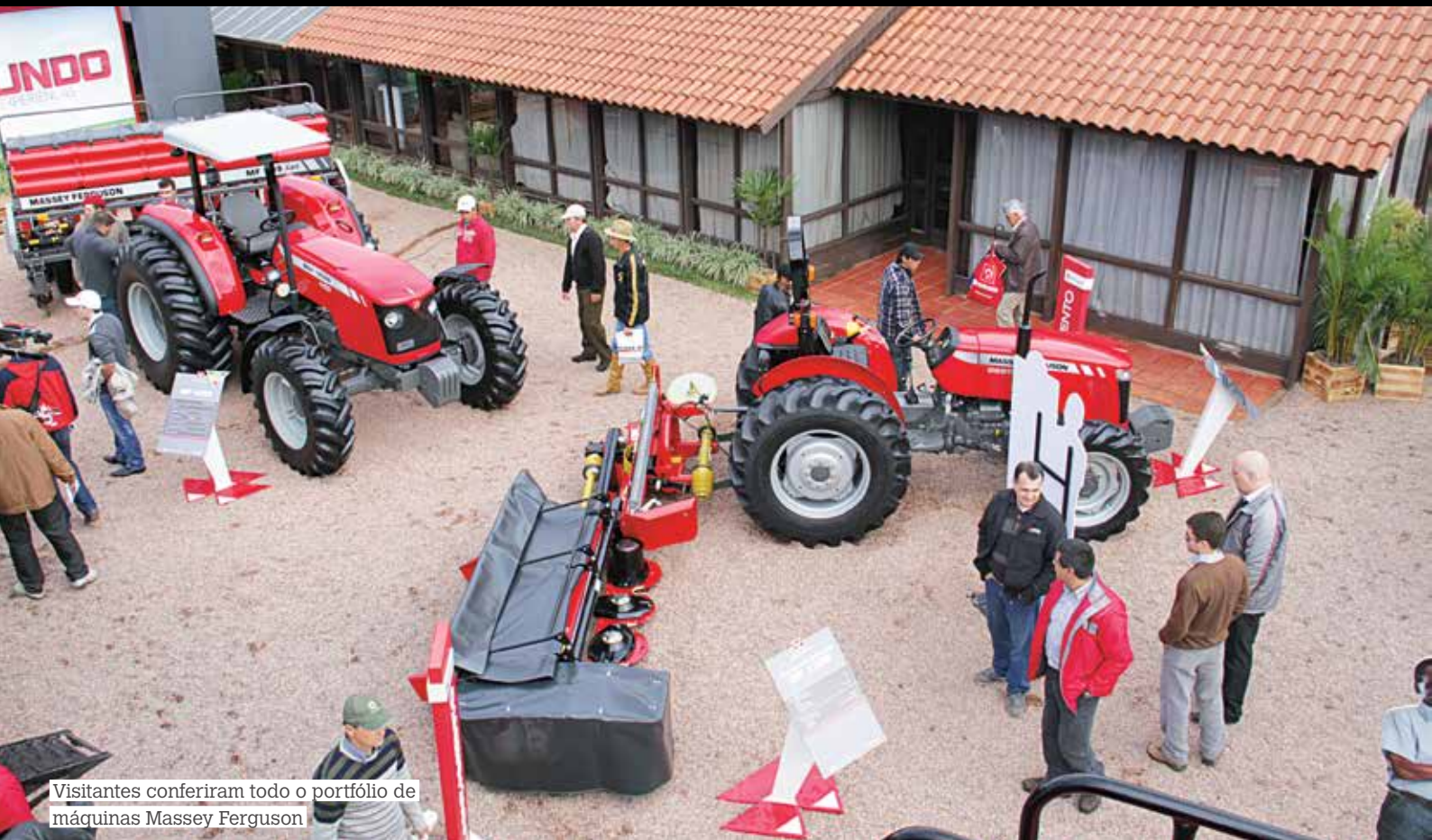
Visitantes conferiram todo o portfólio de máquinas Massey Ferguson

» Até os mais otimistas foram surpreendidos com os resultados da Expointer 2012, detentora de um recorde nunca antes visto de público e de faturamento. De acordo com a organização da feira, ocorrida anualmente em Esteio (RS), foram R$ 2,036 bilhões o valor de negócios protocolados, um incremento de 86,96% em relação ao ano passado. No setor de máquinas e implementos agrícolas o montante chegou a R$ 2,020 bilhões, representando um aumento de 142% sobre 2011. De acordo com o Simers, esse resultado se deve a uma série de fatores, como a queda do PSI para 2,5%, o preço das commodities e o programa Mais Alimentos.