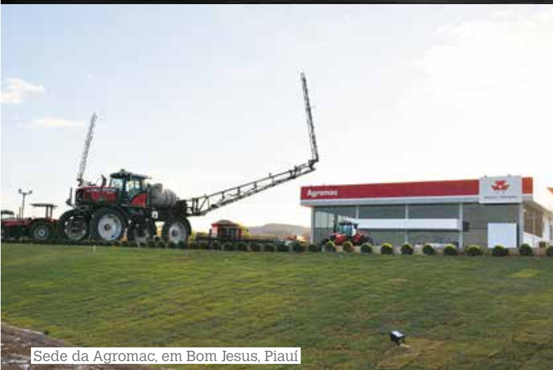
Sede da Agromac, em Bom Jesus, Piauí