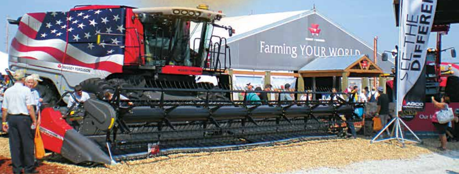
A colheitadeira mais moderna da Massey Ferguson exposta na Farm Progress Show