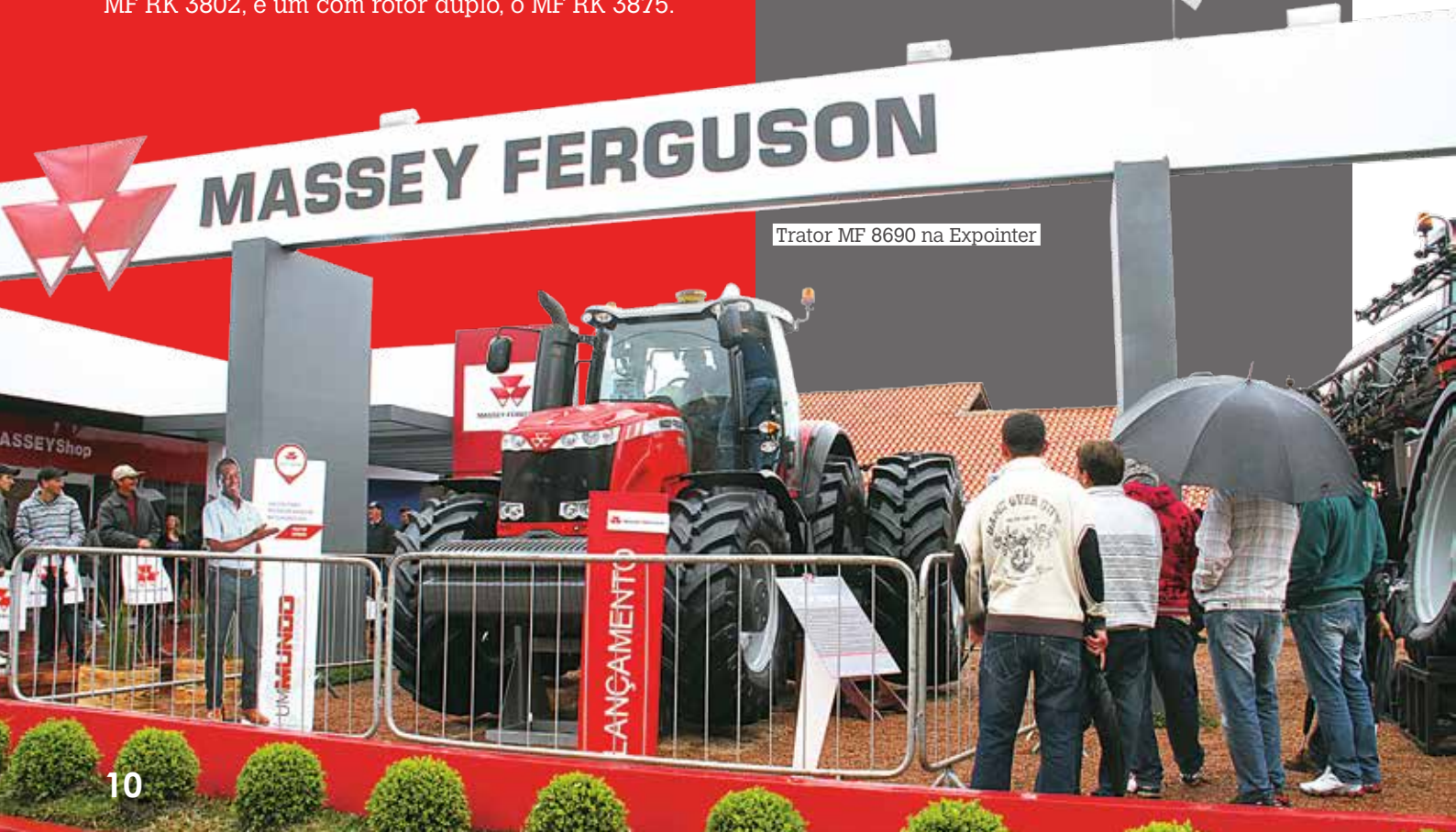
Trator MF 8690 na Expointer

Além dos produtos Massey Ferguson, as grandes estrelas do estande, o público também pôde conferir ações de interação muito divertidas. Entre elas os diversos totens que possibilitavam a visualização de vídeos, fotos e especificações técnicas das máquinas com um simples toque. Outro grande sucesso foi a ação "Você na capa da Campo Aberto", que proporcionou ao público estampar a capa da revista e recebê-la impressa em tamanho A3. Todas as capas personalizadas foram publicadas no Facebook da Massey Ferguson e as três mais votadas ganharam prêmios.