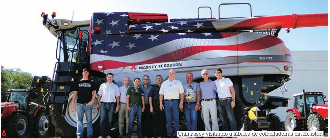
Unimassey visitando a fábrica de colheitadeiras em Hesston