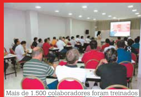
Mais de 1.500 colaboradores foram treinados

» Durante os meses de abril, maio e junho deste ano, representantes da Massey Ferguson participaram do Programa de Desenvolvimento em Atendimento – Atitude em Atender Bem Massey Ferguson. O intuito foi capacitar a rede de concessionárias da marca a melhor atender os clientes. Nesse período, 50 treinamentos foram realizados em 18 cidades do país, totalizando 1.649 colaboradores treinados. Uma consultoria especializada foi contratada pela AGCO para auxiliar na criação de um atendimento padrão para a Massey Ferguson. Para atender a demanda da rede, também foram organizadas turmas extras no mês de julho. É importante salientar que todo esse processo teve origem na pesquisa de satisfação de clientes, realizada no ano de 2010.