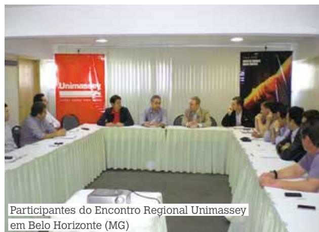
Participantes do Encontro Regional Unimassey em Belo Horizonte (MG)