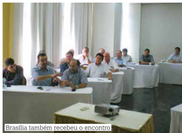
Brasília também recebeu o encontro