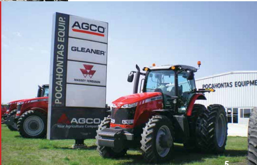
MF 8650 em frente à concessionária Pocahontas

A feira reúne os principais fabricantes de máquinas e implementos agrícolas que atuam no mercado norte-americano e é realizada desde 1953. No evento deste ano participaram mais de 500 expositores e um público de mais de cem mil pessoas esteve no local durante os três dias de sua duração. Ocupa uma área de 35 hectares, utilizada para exposição estática e de equipamentos agrícolas, e outros 120 hectares para demonstrações de campo e test drive .