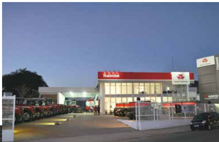
Loja encontra-se instalada em área de 5.100 metros quadrados