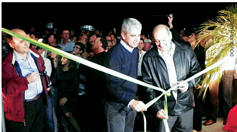
Inauguração em Cruz Alta

Inspirada na comemoração dos 50 anos da Massey Ferguson, a Redemaq resolveu brindar seus clientes com a inauguração de três novas instalações. Na cidade de Itaqui, em continuidade a um planejamento estratégico de expansão, abriu uma nova filial no mês de junho. Nas cidades de Cruz Alta e Tupanciretã, entregou em agosto a modernização de suas filiais já existentes naquelas cidades, para melhor atender os clientes Massey Ferguson da região.