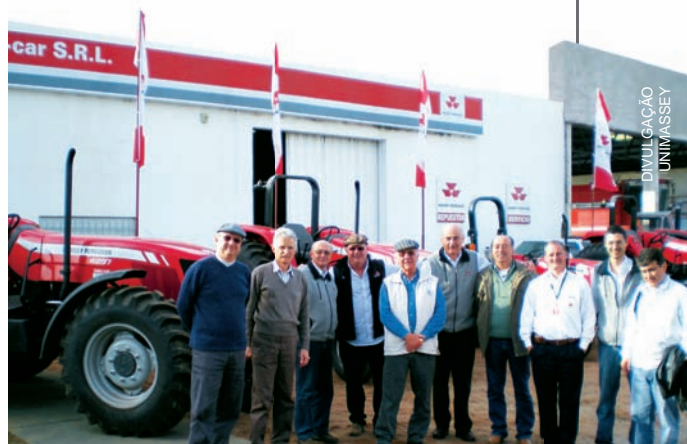
Grupo em visita à concessionária Agro Car