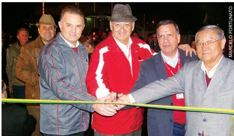
Inauguração em Itaqui