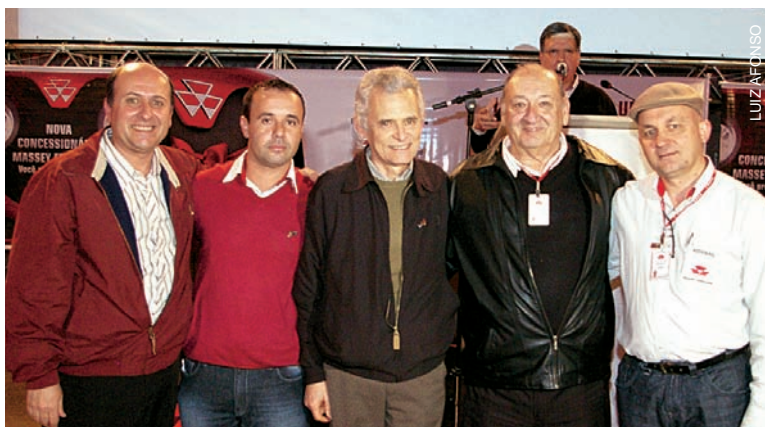
Inauguração em Tupanciretã