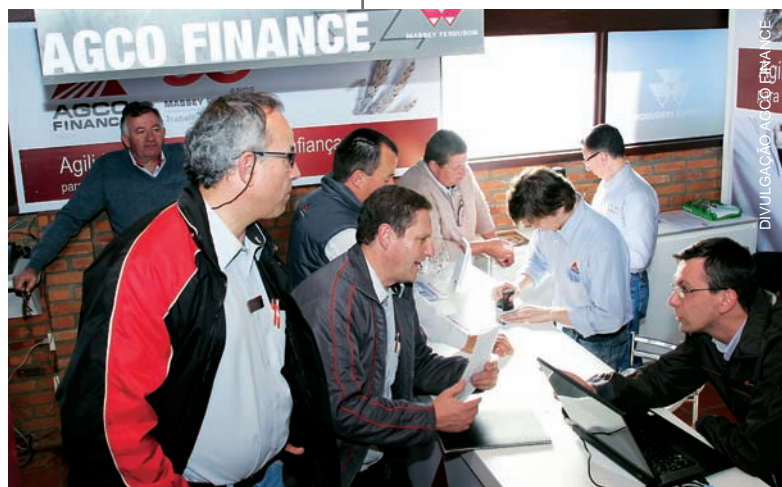
Espaço da AGCO Finance no stand da Massey Ferguson

Já a AGCO Parts preparou para a feira uma ação especial. O suporte de peças genuínas Massey Ferguson apresentou uma promoção cultural, na qual o cliente deveria responder a seguinte frase: “Por que usar peças genuínas AGCO Parts no seu Massey Ferguson?” A cada dia a resposta mais criativa recebia um kit de revisão para motores, composto por um balde de 20 litros de óleo Shell, dois filtros de óleo diesel e um filtro de óleo lubrificante AGCO Parts.