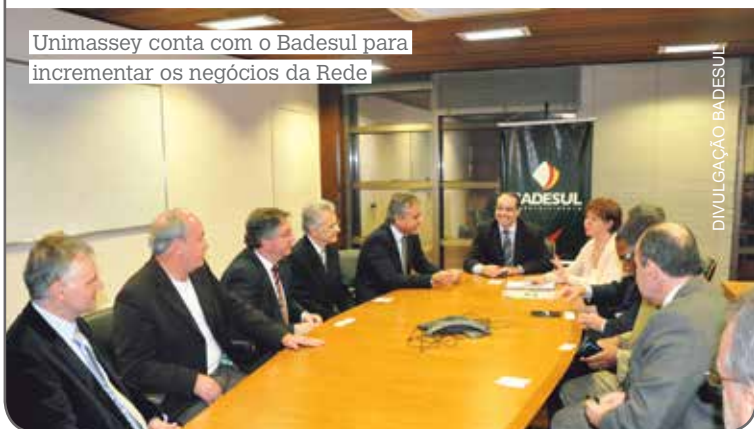
Unimassey conta com o Badesul para incrementar os negócios da Rede