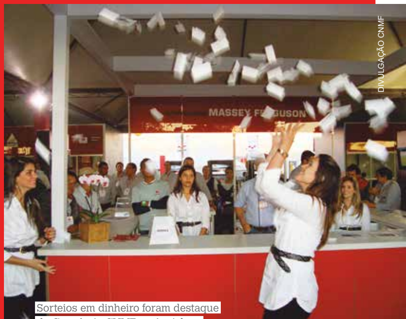
Sorteios em dinheiro foram destaque do Consórcio CNMF na Agrishow

unidades com a participação das concessionárias Guimarães, Volmaq e Jumasa.