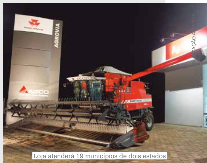
Loja atenderá 19 municípios de dois estados