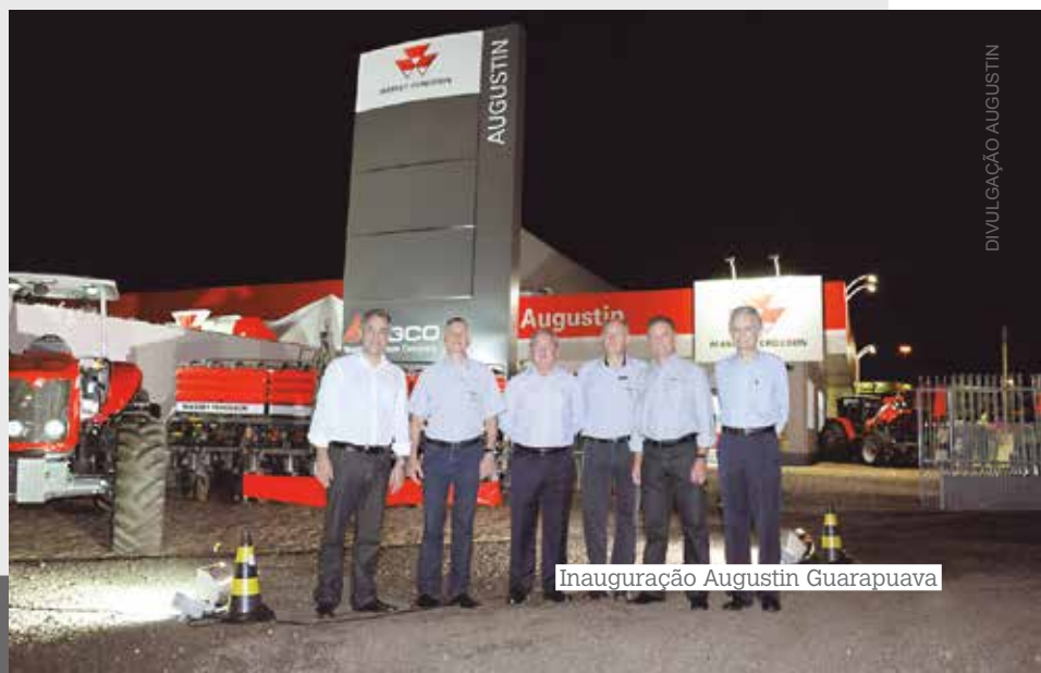
Inauguração Augustin Guarapuava