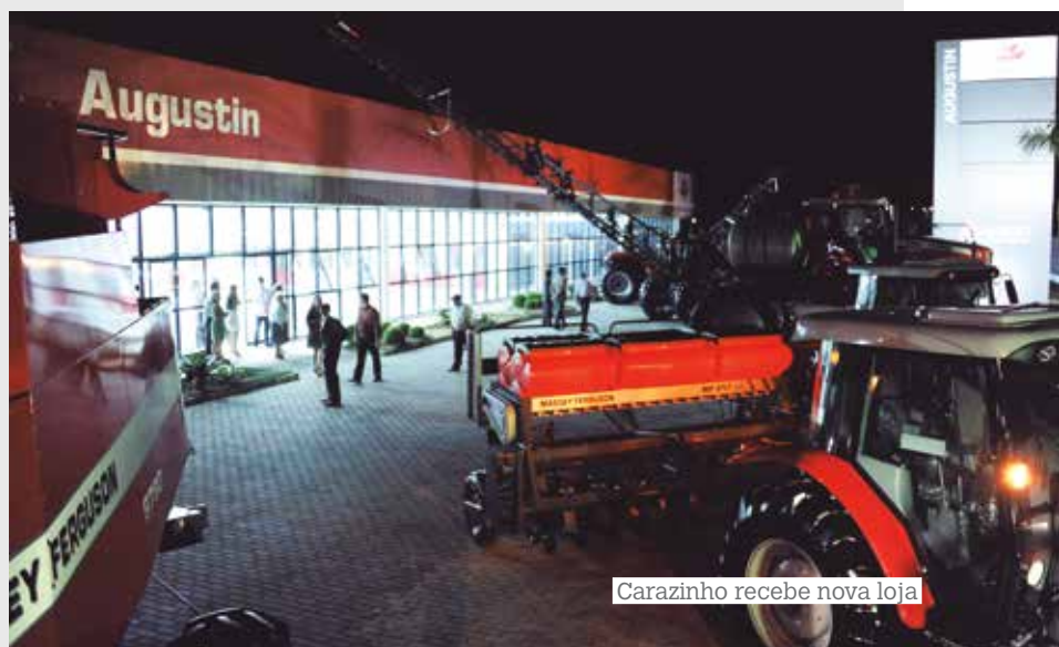
Carazinho recebe nova loja

Com 85 anos de existência, a Augustin é considerada uma das concessionárias mais tradicionais da Massey Ferguson. Atuando hoje em 75 municípios do RS, a empresa projeta uma grande expansão. Inaugurou no início do ano uma nova filial em Guarapuava, marcando seu ingresso no estado do Paraná, onde está presente em 37 municípios.