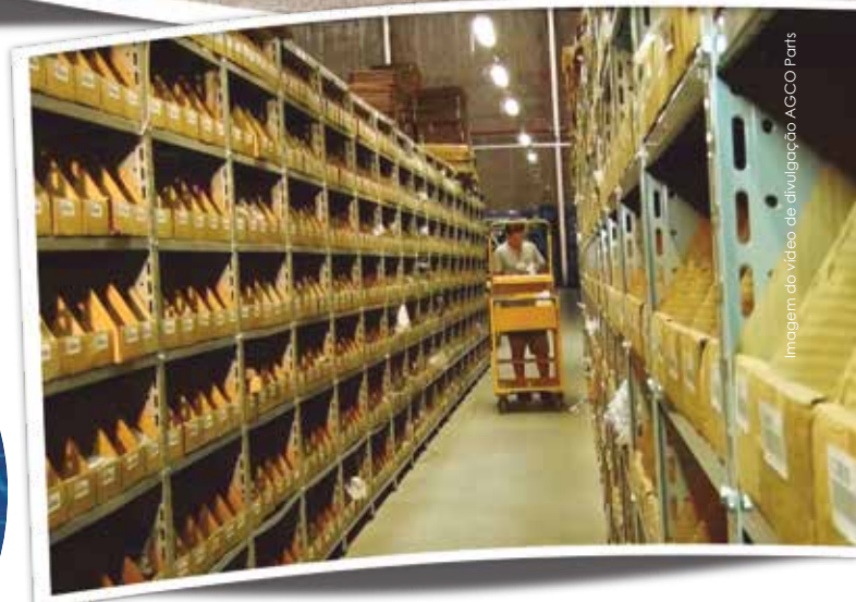
Imagem do vídeo de divulgação AGCO Parts