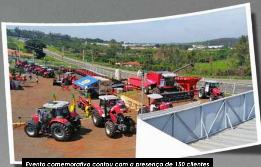
Evento comemorativo contou com a presença de 150 clientes

» O lançamento do trator MF 6711, junto à apresentação da colheitadeira híbrida MF 5690, marcou a comemoração de 64 anos da Somassey