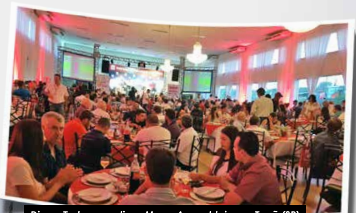
Disma Tratores realizou Mega Assembleia em Tupã (SP)

Noite contou com 50 contemplações e show da dupla Marcos Paulo e Marcelo