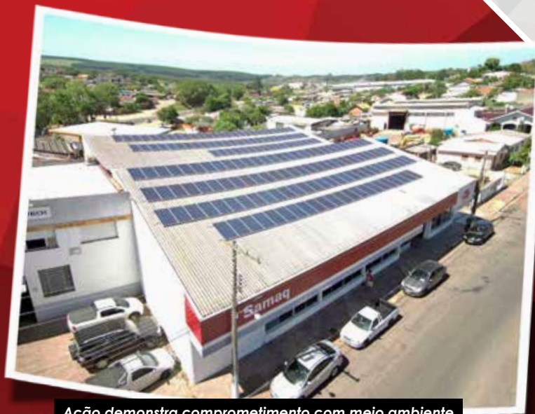
Ação demonstra comprometimento com meio ambiente

Lojas da Samaq possuem placas para geração de energia