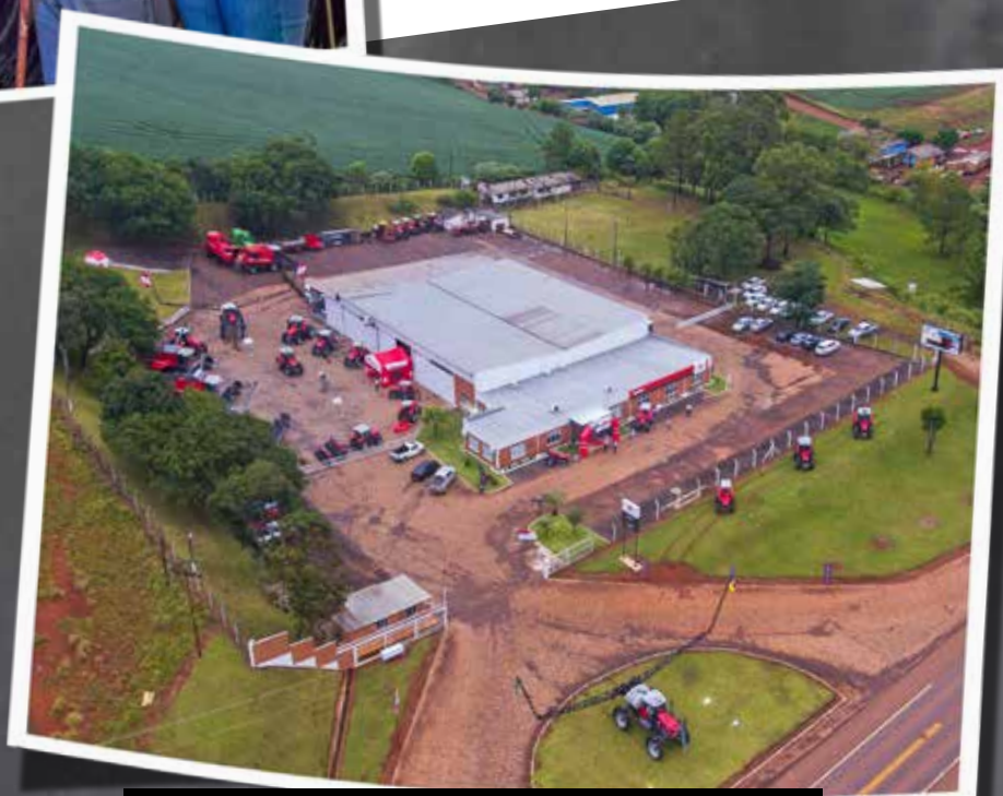
Espaço conta com oficina e pátio para exposição de produtos

Localizada às margens da RST-569, as novas instalações da concessionária contam com 1.900 m 2 de área total, sendo 1.200 m 2 de área construída, que englobam uma ampla oficina e um pátio para exposição de produtos. Durante o evento, os especialistas da fábrica apresentaram os últimos lançamentos em tratores, colheitadeiras e pulverizador da marca. Os clientes que adquiriram máquinas recentemente também foram presenteados com brindes exclusivos.