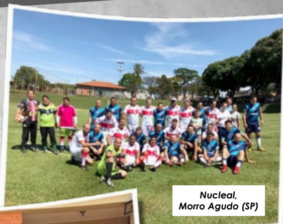
Nucleal, Morro Agudo (SP)