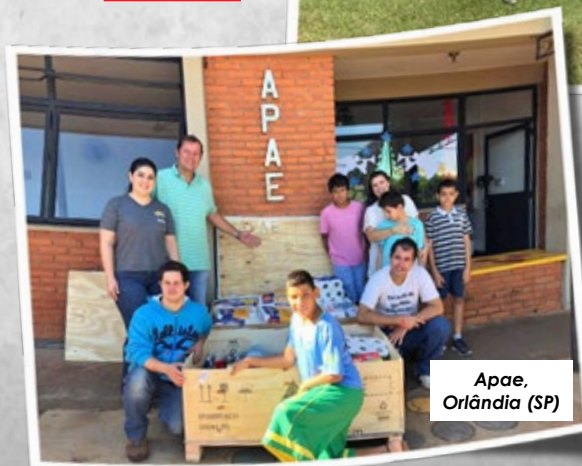
Apae, Orlandia (SP)