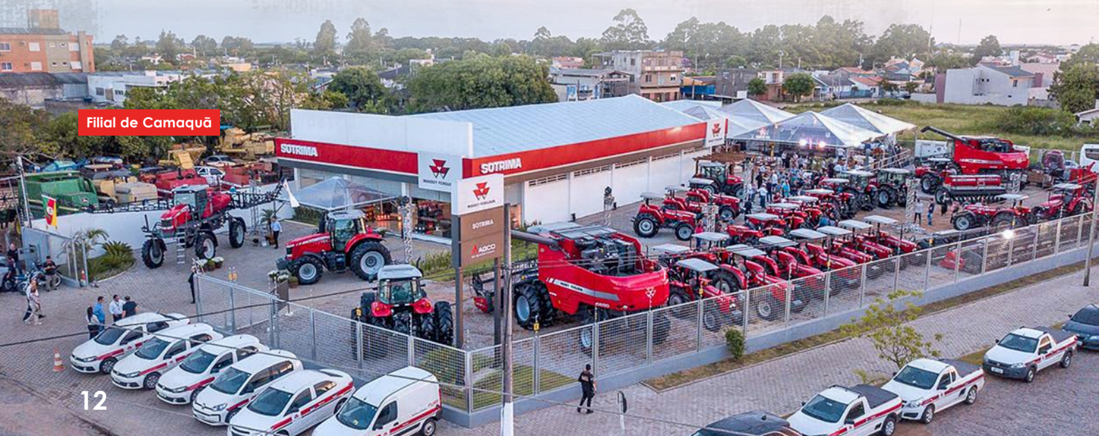
Filial de Camaquã