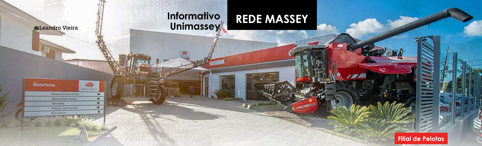
Filial de Pelotas